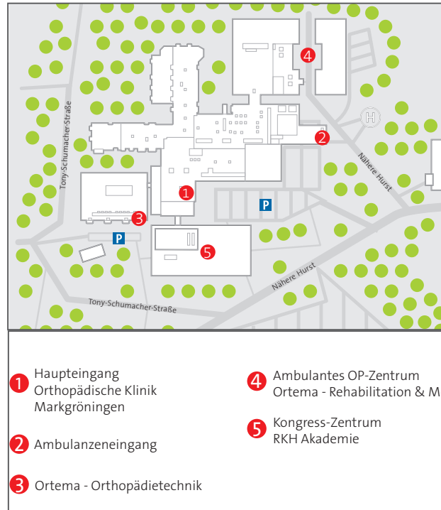
Anfahrtsskizze OKM & ORTEMA in Markgröningen

Kurt-Lindemann-Weg 10 71706 Markgröningen